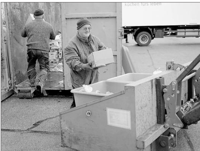
Der Reinerlös dieser Sammlungen wird ca. 28.000 € betragen.

Insgesamt wurden im Abrechnungsjahr 2011/2012 135.340 kg Altpapier sowie 49.260 kg Gebrauchtkleider und Schuhe gesammelt.