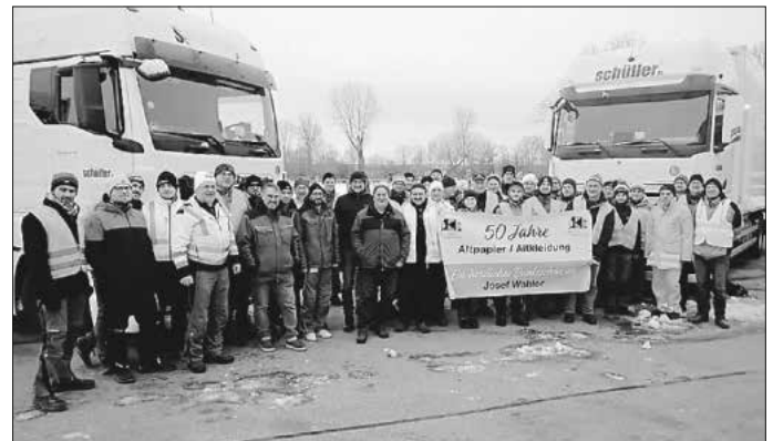
Gemeinschaftsfoto vor dem Sammlungseinsatz am 4.1.2025

Am 4. Januar führte die Kolpingsfamilie Herrieden ihre 50. Haus- und Straßensammlung für Altpapier und Gebrauchtkleider durch. Mit dem Erlös konnten bisher mehr als 500.000 € für caritative, soziale und kirchliche Hilfsprojekte weltweit zur Verfügung gestellt werden.