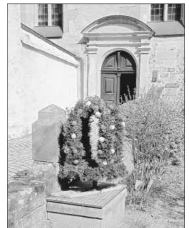
Osterbrunnen im Büchereigarten

10.5.1933 Bücherverbrennung in Deutschland: Ein Gedenken an kritische Autoren - von und mit Norbert Brumberger