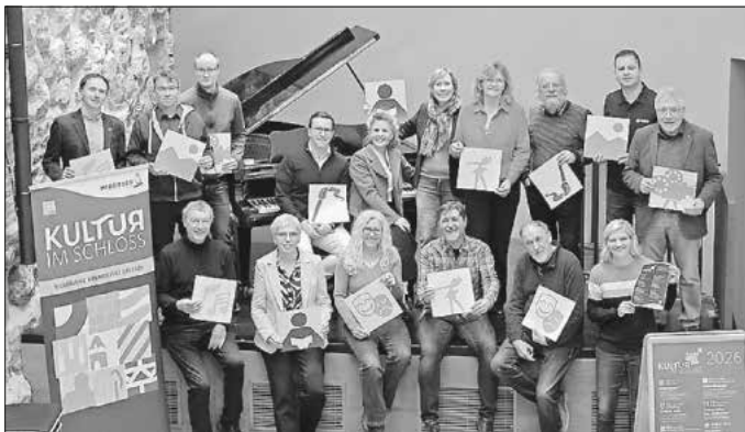
Die Veranstalter der neuen Kulturreihe „Kultur im Schloss“ stellten vor Kurzem das Jahresprogramm 2026 vor.