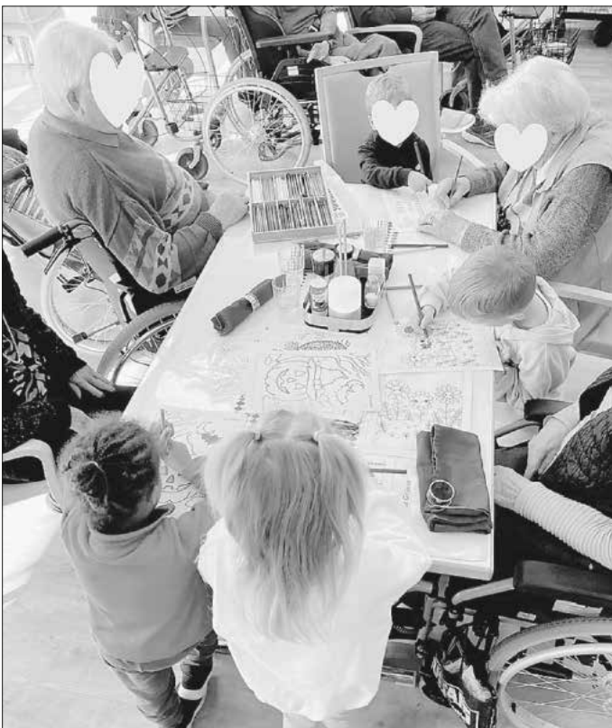
Gemeinsames Malen im Caritas-Seniorenheim St. Marien

Für künftige Treffen gibt es schon viele Ideen: Zum Beispiel gemeinsames Filzen zur Förderung von Tastsinn und Kreativität oder Vorlesestunden, um die emotionale Bindung zu stärken sowie, um Sprache und Zuhören zu trainieren. Durch die Zusammenarbeit der Einrichtungen für Jung und Alt entsteht Verständnis füreinander – und praktisch gelebte Gemeinschaft.