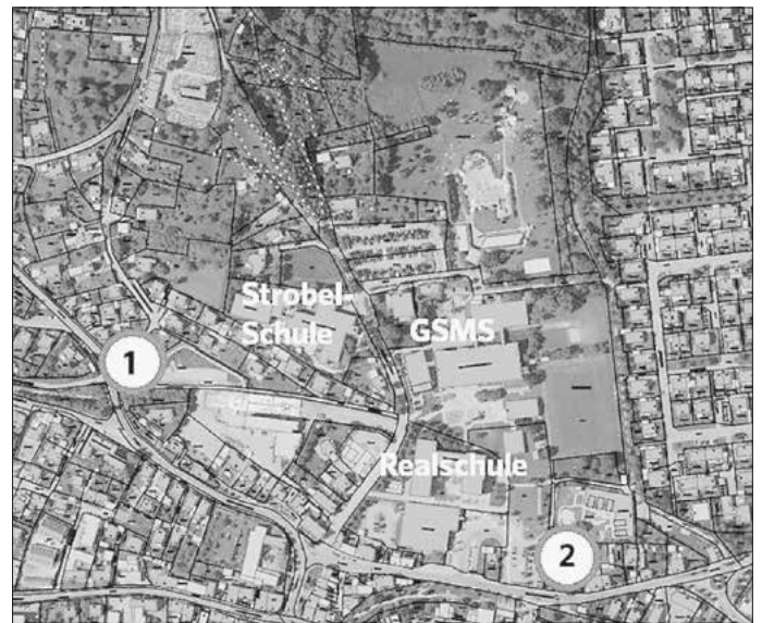
Eltern-Taxi-Haltestellen: 1: Ansbacher Straße – Traföhäuschen, 2: Parkplatz Münchener Straße – Ampel

Im besten Fall bestreiten die Herrieder Kinder ihren gesamten Schulweg zu Fuß.