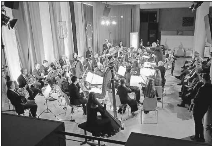
Die Erzgebirgische Philharmonie Aue gastierte traditionell in der Aula der Grund- und Mittelschule zum Neujahrskonzert.