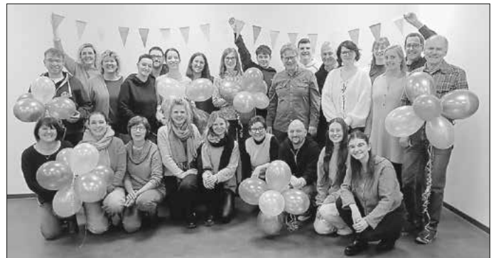
Die Organisatoren der einzelnen Faschingsveranstaltungen sowie Verantwortliche einzelner Gruppen des Faschingsumzuges