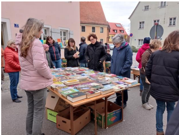
Bücherflohmarkt am Kathreinmarkt