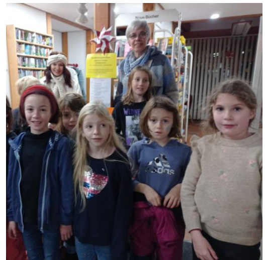
Besuch vom Christkind