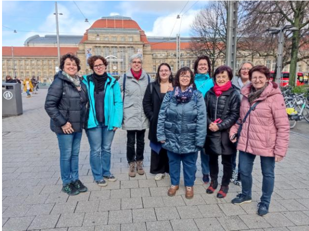
Fahrt zur Buchmesse nach Leipzig