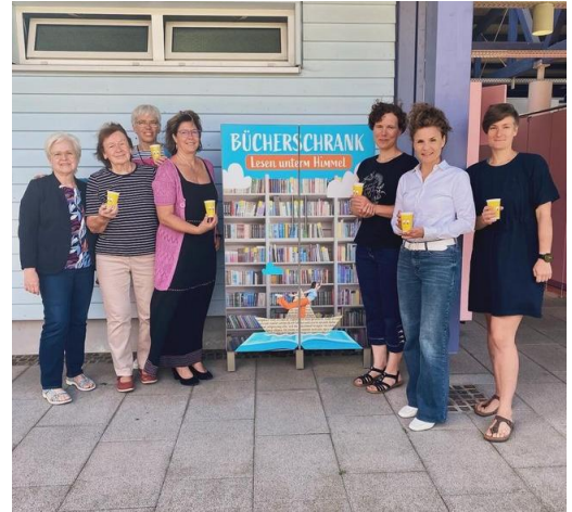
Freibadschrank in neuem „Look“