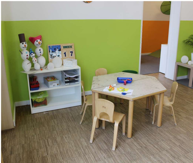
Die Mal- und Bastecken