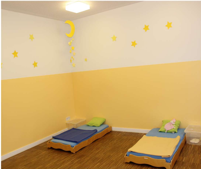
Ruhe- / Schlafraum und Angebotszimmer