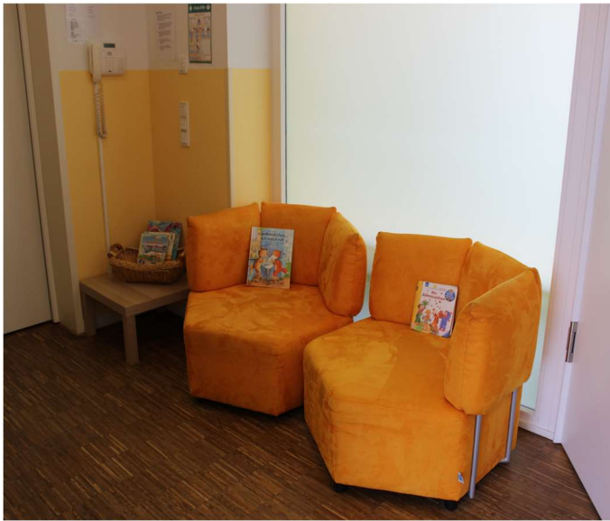
Die Lese- und Ruheecken