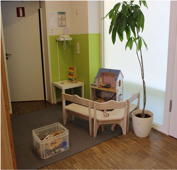
Die Rollenspielecken mit z.B. dem Puppenhaus und der Puppenwohnung