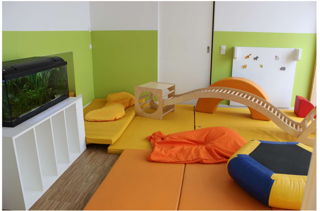
Das Neben- bzw. Angebotszimmer