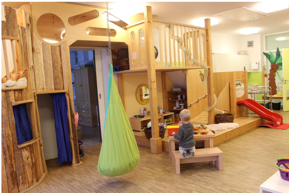
Die Spielelandschaft mit der Puppenwohnung