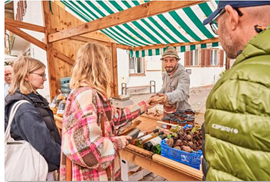
Regionaltag 2023 Zugspitz Region