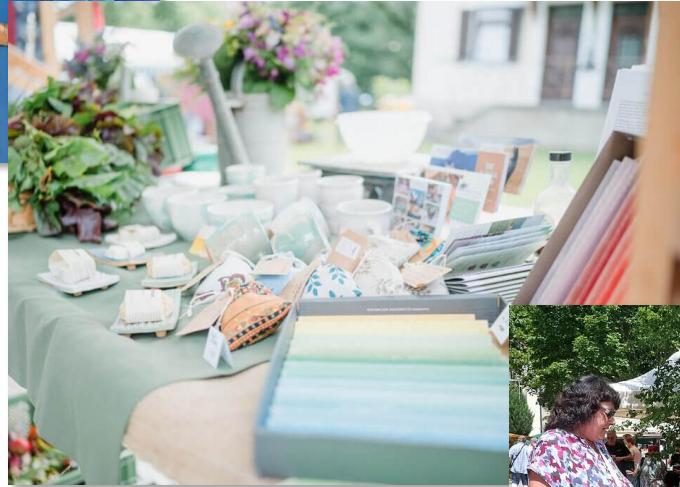
Regionaltag 2024 Ohlstedt © Max Merget