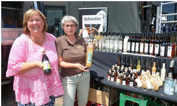
Regionaltag Bad Rappenau

Der Regionaltag als Angebotsplattform für Direktvermarkter, egal ob Metzgereien, Bäckereien, Landwirte, Imkereien etc.