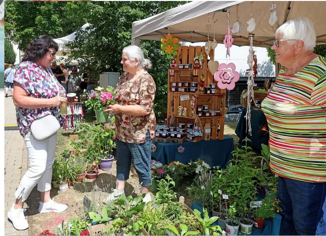
Regionaltag Bad Rappenau