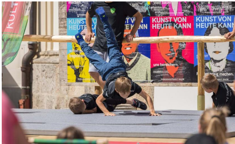
Tag der Vereine Traunstein

... Vereine kommen am Stand mit Besuchern aus der Region in Kontakt