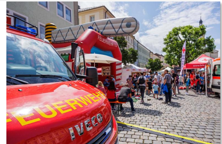
Tag der Vereine Traunstein

... Vereine kommen am Stand mit Besuchern aus der Region in Kontakt