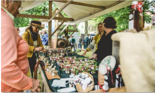
Regionaltag Landkreis Traunstein