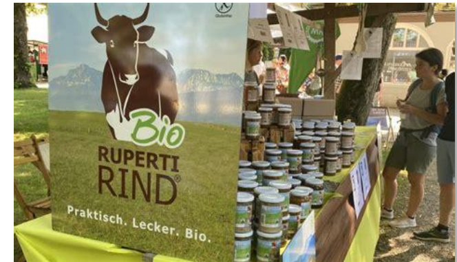
Regionaltag 2023 Landkreis Traunstein