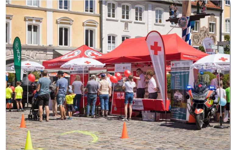
Tag der Vereine Traunstein