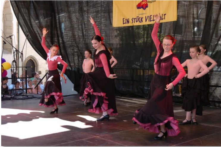
Regionaltag 2005 Craillshheim