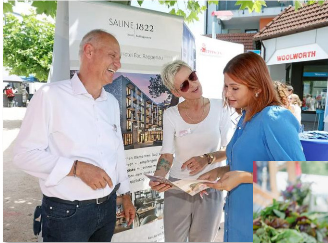
Regionaltag Bad Rappenau