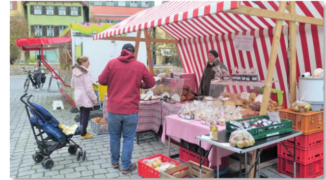
Regionaltag 2023 Dinkelsbühl

Der Regionaltag als Angebotsplattform für Direktvermarkter, egal ob Metzgereien, Bäckereien, Landwirte, Imkereien etc.