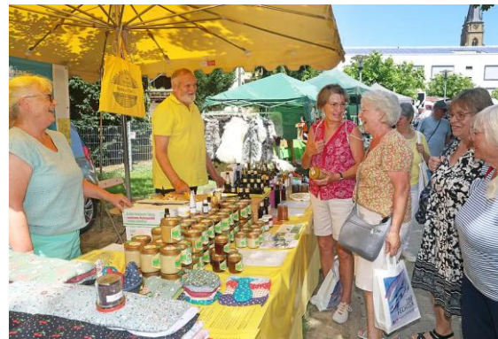
Regionaltag Bad Rappenau