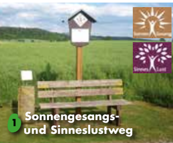
1 Sonnengesangs- und Sinneslustweg