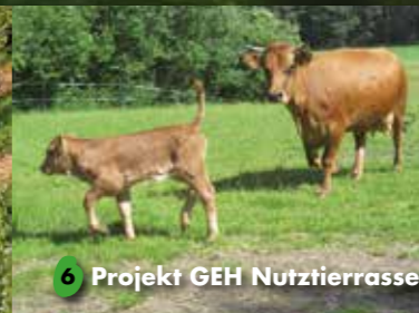
6 Projekt GEH Nutztierassen mit Café