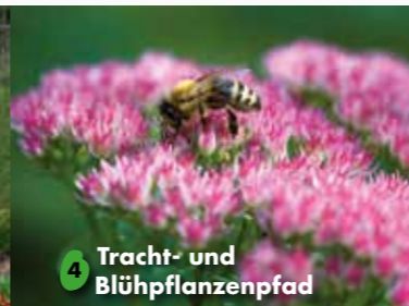
4 Tracht- und Blühpflanzenpfad