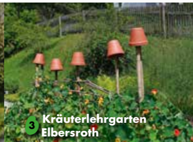
3 Kräuterlehrgarten Elbersroth