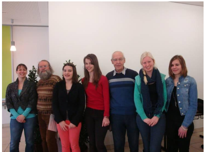
Jury beim Vorlesewettbewerb