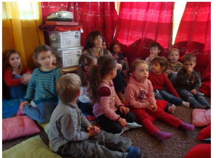
Bilderbuchkino im Kindergarten Rauenzell